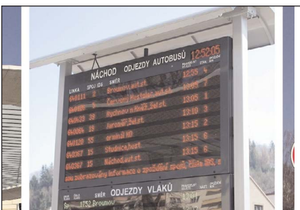
Pohodlí se získáním informací o odjezdu autobusů nebo vlaků mají v poslední době cestující na více místech v kraji.