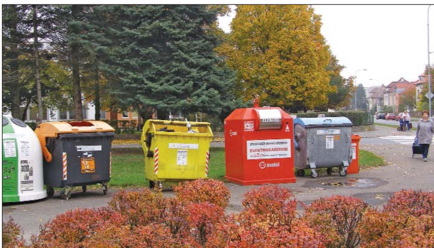
Mezi sběrnými nádobami na sídlišti Labská kotlina II. v Hradci Králové zatím hnědé nádoby na bioodpad chybějí. Obyvatelé však mohou do speciální nádoby odložit použitý olej, což je unikátní.

biopopelnic do fermentační stanice a neustále přibývají další zájemci o tuto službu. Nutno konstatovat, že tato služba je pro občany Úpice zdarma. Jde o odpad bez nutnosti dalšího třídění a kázeň občanů je příkladná, patří jim poděkování. Popelnice na bioodpad si však občané již kupují sami. Vedle toho se bioodpad sváží z městských zařízení, školních jídelen a končí u nás i veškerá zeleň posekaná ve městě technickými službami. Dalším zdrojem surovin jsou potom bioodpady od podnikatelských subjektů, pro které je likvidujeme za úplat. Měsíčně zpracuje stanice až 650 tun odpadu. Zajištěním optimální skladby surovin pro fermentaci, třeba i zakoupením dalších surovin, se daří denně vyrábět kogenerační jednotkou