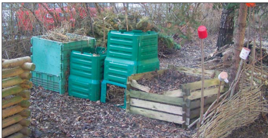
Kompostování na zahradu patří. Rozličné typy plastových kompostérů (viz foto z archivu) mají jednu společnou nevýhodu – jsou malé a dosti obtížně se zetlelá část zespu oděbírání. Skládací dřevěné kompostéry se zdají výhodnější, ale zase jejich životnost je asi jen deset let. Ve vývoji jsou různé plastové i drátěné nádoby uměleckého tvaru. Ve městech takovéto kompostéry většinou slouží v zahradách škol a školek. (Více na: kompostuj.cz , ekodomov.cz .)

známé hnědé kompostainery, které se svážejí v sezóně jedenkrát týdně. Touto cestou se daří úspěšně snižovat množství odpadu, které by jinak mohlo skončit v nádobách na komunální odpad. Kromě toho mohou občané odevzdávat bioodpad ve sběrných dvorech. Současně město podporilo výchovu k ekologii a třídění bioodpadů řadou grantů pro školy a mateřské školky. Odpady ze zahrad a zahrádek začaly tedy třídít i mateřské či základní školy, které mají k dispozici nádoby