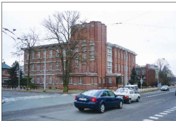
Úspěšné sloučení střední školy a učiliště v Hradci Králové

víceletých gymnázií. Měly by vzdělávat talentované děti, jejich procento se v populaci pohybuje kolem 5 %, ale ve skutečnosti jsou cílem dětí ze sociálně lépe situovaných rodin. Obávám se, že problém dále vyhrtí očekávaná inkluze – nově nazvaná „Společným vzděláváním“ – tedy integrace žáků s lehkým mentálním postižením do běžných tříd základních škol. Narostou požadavky na domácí vzdělávání, které je zcela mimo systém, a nápor na víceletá gymnázia zesílí. Je potřeba zájmy zaměstnavatelů, škol a hlavně rodičů sladit, jinak