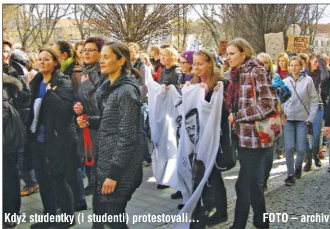
Když studentky (i studentii) protestovali...

Kraj a jeho úředníci mají přehled o situaci, znají ji a podle toho rozhodují. Proč to