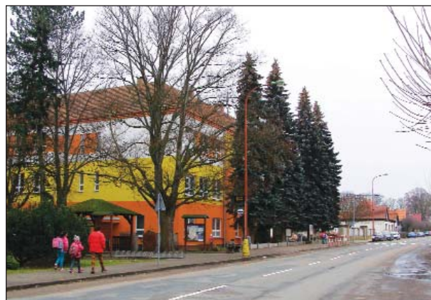
Skřivanská základní škola je pěkně opravená a čeká na nový semafor i na opravu školní družiny.

V obci žije skupina Romů, práce obecně mnoho není, takže nezaměstnaným pomáhají z obce alespoň organizováním